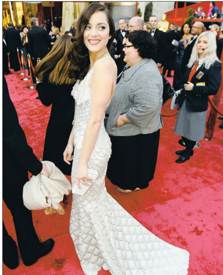
Marion deberá aclarar sus opiniones respecto a los sucesos de 9/11.

Agregó que la infraestructura de las Torres Gemelas estaba obsoleta y su mantenimiento resultaba excesivamente caro, y que hubiera costado más dinero remodelarlas que reconstruirlas, razón por la cual fueron destruidas.