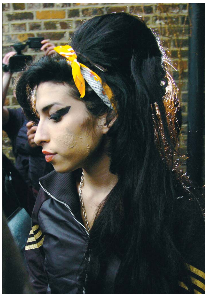
Su representante asegura que Amy no se esconde de la gente y se encuentra bien.

Recientemente se informó que Winehouse, de 24 años, volvió a recaer en las drogas, luego de haberse sometido a un tratamiento de desintoxicación, aseguró el diario británico The Sun.