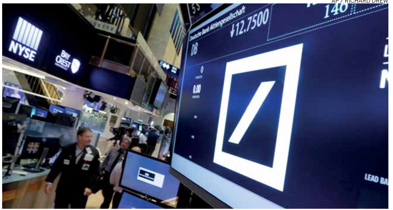
Poco dinero para cubrir una posible multa multimillonaria ha dado pie a corredores de bolsa de apostar en contra del banco más grande de Alemania.

tanto Donald Trump, el candidato republicano, como Hillary Clinton, la demócrata, han dicho que los tratos de libre comercio perjudican al trabajador estadounidense.