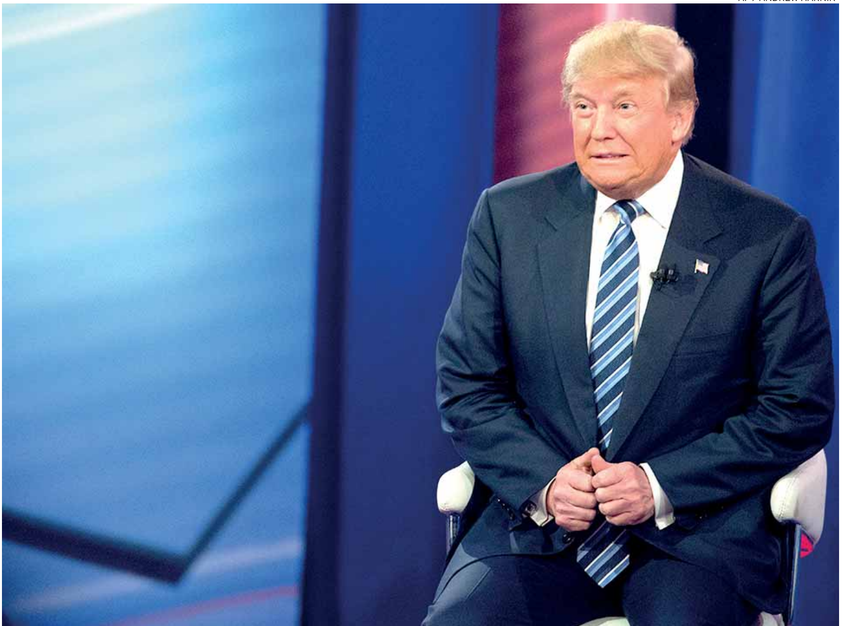
Trump, que se dice el gran negociador, puede desdeñar las opiniones de los principales ejecutivos del país, pero quizá sea porque no ha logrado llegar a un acuerdo con ellos.